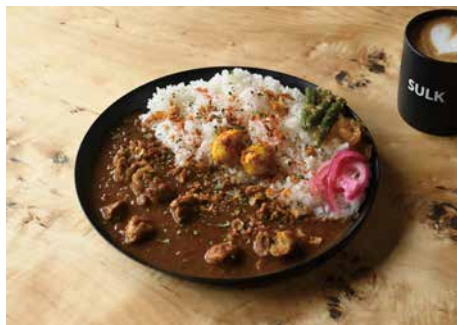
SULK カレー ¥1,200