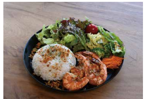
ガーリックシュリンプ ¥1,800